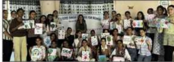
छात्रों, स्टेड अकाशा।

जीजीएससीडब्ल्यू के रेखी गेटवे और एक्सलेंस परिसर में आयोजित मानसिक स्वास्थ्य शिविर के माध्यम से 3-दिवसीय मानसिक स्वास्थ्य शिविर (8-10 अक्टूबर, 2024) की सफलतापूर्वक योजना की। शिविर का उद्देश्य कक्षाएं/घर, नया लेखन, फोटो बनाना, पोस्टर बनाने और व्यक्तिगत मूल्यांकन सहित विभिन्न